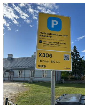
Parkimist korraldab infotahvel Kooli 6 väravas.