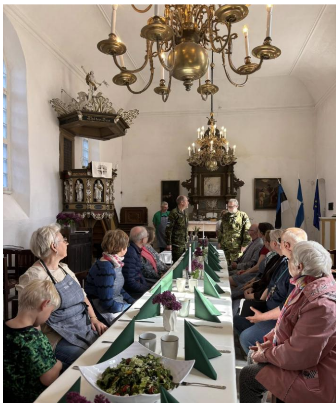
Pika laua ümber.