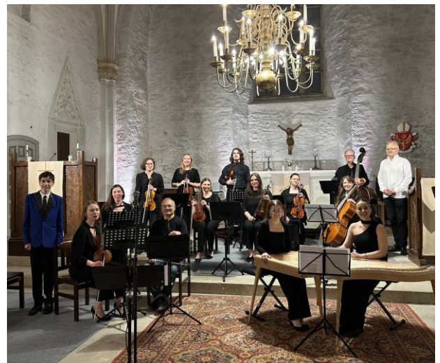
Tallinna Tehnikaülikooli kammerorkester Haapsalu toomkirikus muuseumiööl esinemas.