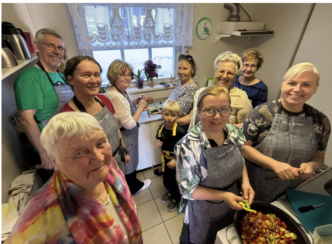
Ühiselt kokkamas.