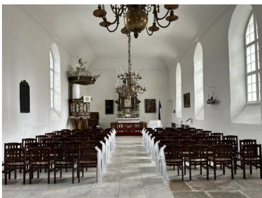
Haapsalu Jaani kiriku sisevaade.

Ma rõõmustasin, kui mulle öeldi: „Lähme Issanda kotta!” Ps 122:1, Palveteekonna laul