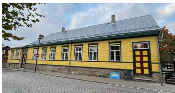
Ajaloolise pastoraadihoone esikülg on saanud värrika ilme.

EELK Haapsalu Püha Johannese kogudus alustas 2025. aastal Haapsalu vanalinna muinsuskaitsealas aadressil Ehte 4 asuva ajaloolise pastoraadihoone fassaadi restaureerimist ja maja tänavapoolne külg on saanud värske ilme. Tööd jätkuvad tänava ja ilmselt ka veel kahel järgmisel aastal.