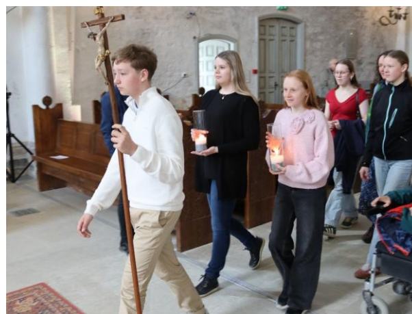
Emadepäeva jumalateenistusele kogunemas.