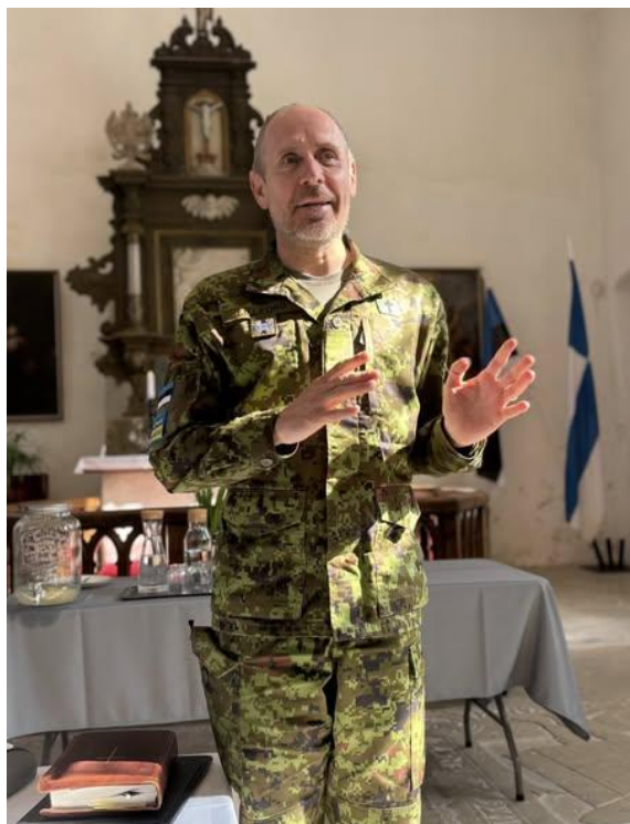
Peakaplan Ago Lilleorg

Peakaplan võttis piiblitunni kokku seitsme soovitusena.