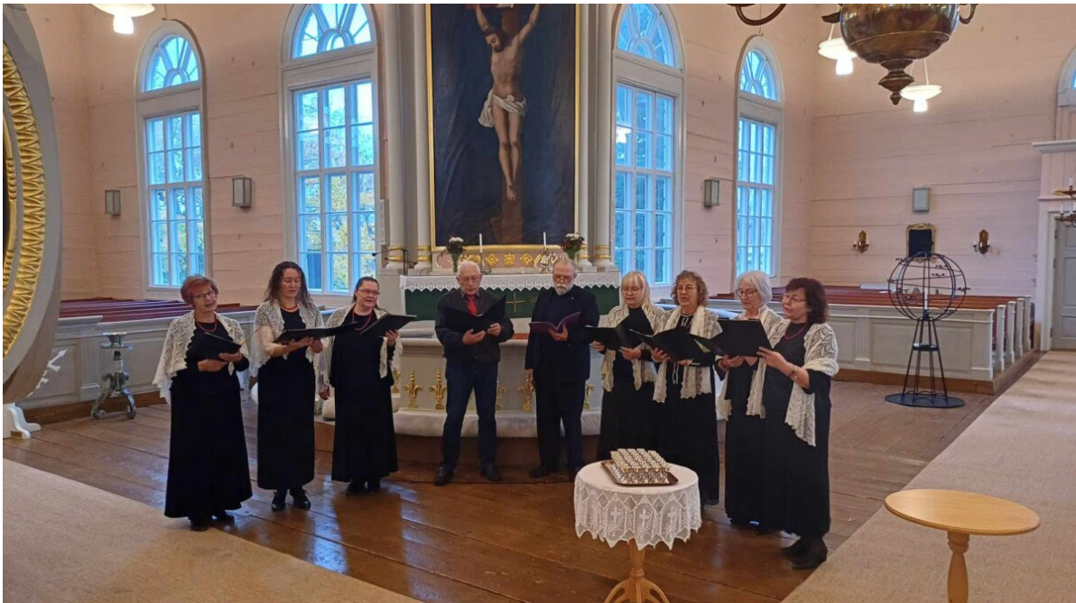
Laulame Korsnäsi kirikus