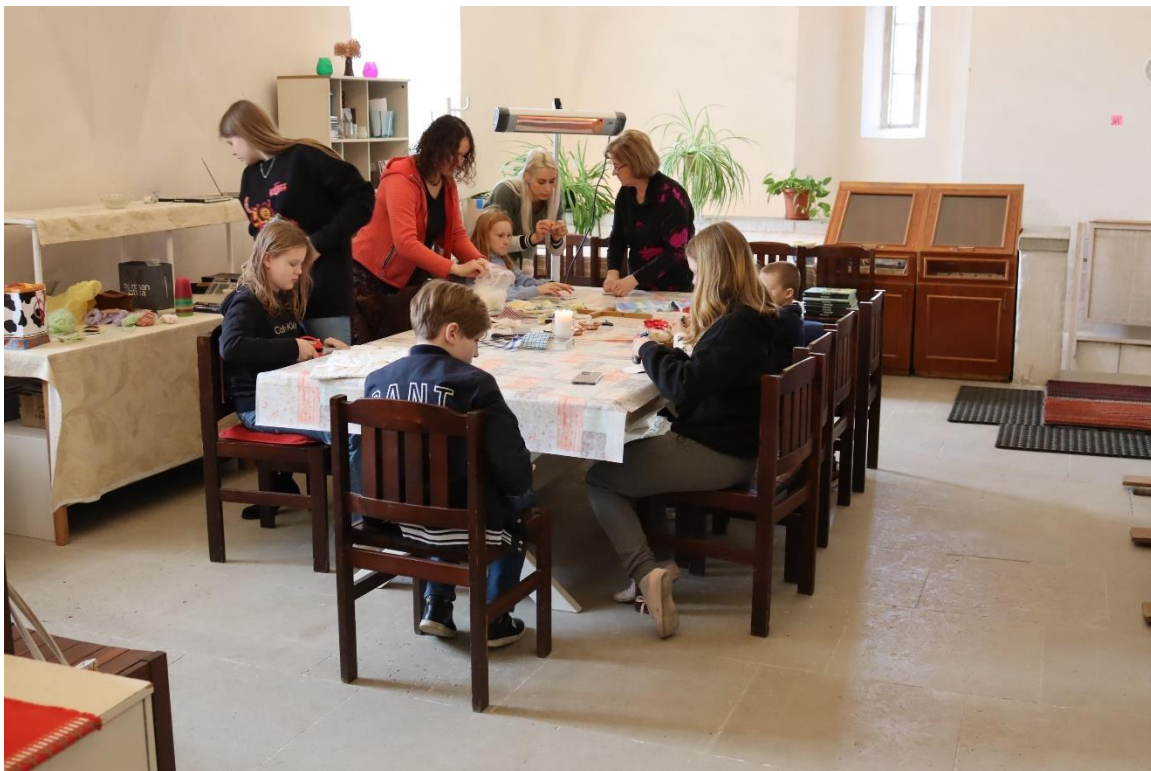
Lastetundi kogunetakse toomkiriku käärkambris.