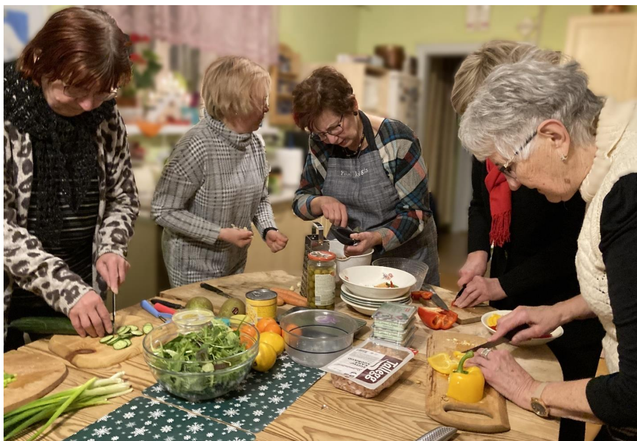
Nii need parimad retseptid sünnivad.