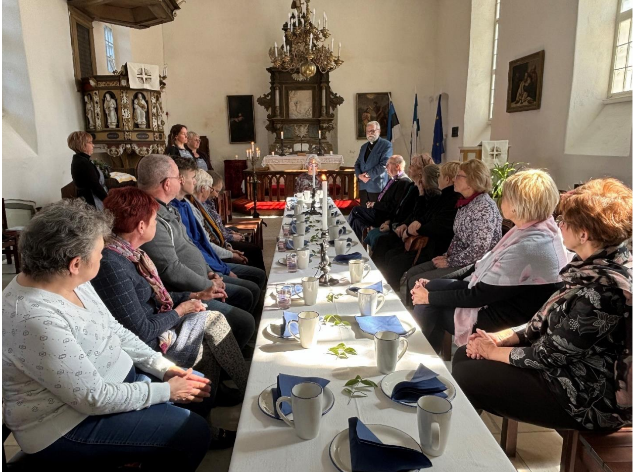
Meie kooskäimistel saab toidetud nii vaim kui ka ihu.

Uue hooaja teeb eriliseks, et teksil on pikaajase unistuse elluviimine – „Piibel köögis” kokaraamat, milles on nii ihu- kui ka vaimutoidu retsepte. Kui kõik läheb plaanipäraselt, ilmub raamat oktoobri lõpuks.