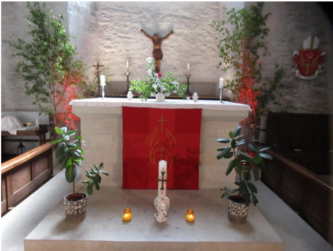
Pühapäeva hommikused jumalateenistused on Haapsalu toomkirikus.

Kord kuus laupäeviti kutsume Taizé palvusele, kus olulisel kohal on meditatiivne muusika, vaikus ja küünlavalgus.