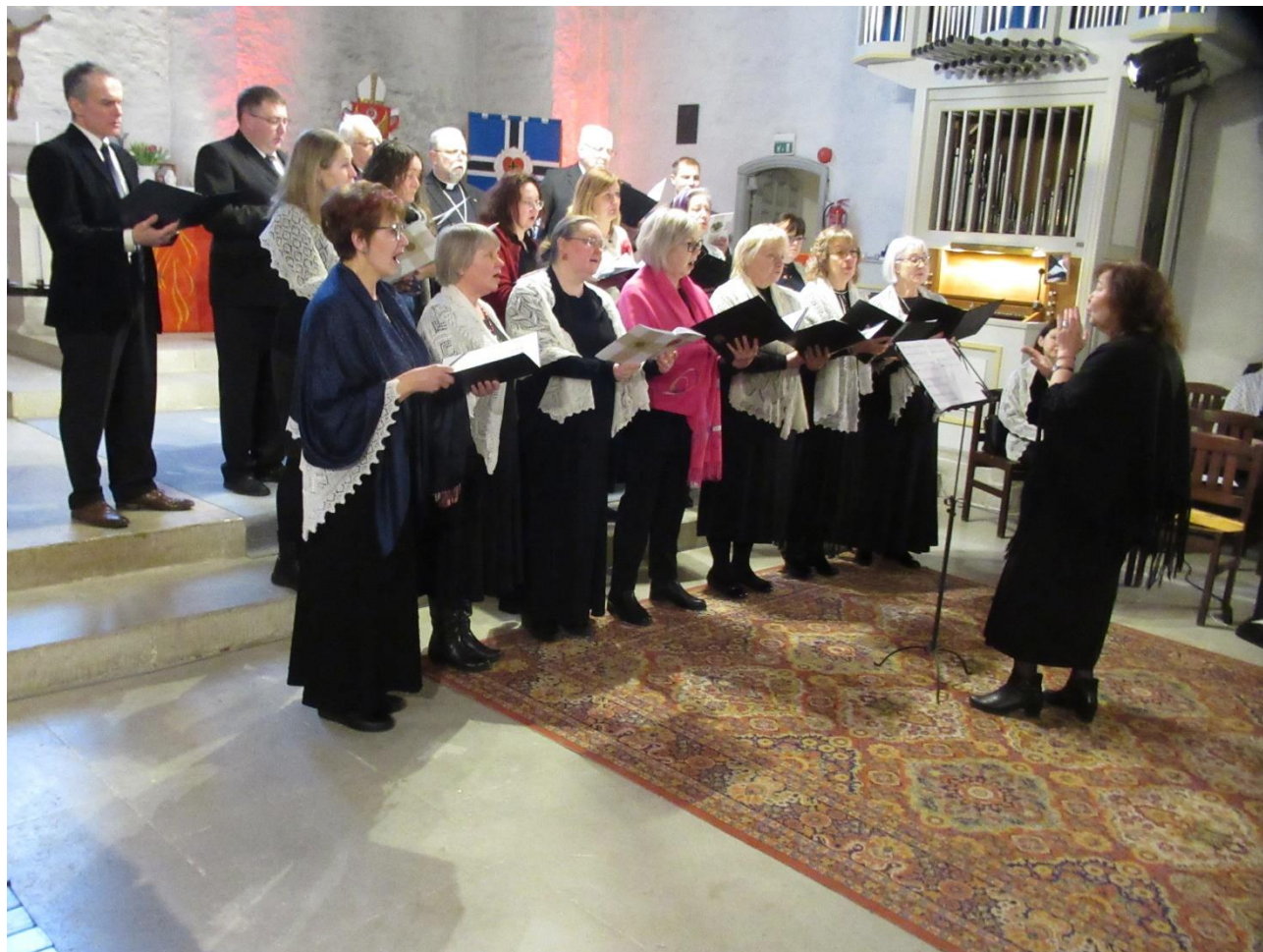
Kirikukooride eripärane oskus on oma muusikaga kaasa teenida koguduse jumalateenistustel.

Toomkoor koguneb teisipäeviti kl 18.30 Jaani saalis. Uus hooaeg algab 3. septembril kell 19.30 (NB! Aeg muudetud.). Tuleb tihe ja töökas aasta, sest koor on registreeritud järgmise aasta üldlaulupeole. Tuleb arvestada lisaproovidega. Muidugi on kavas ka esinemised oma kirikus. Segakoori proovid jätkuvad tavapäraselt kolmapäeviti kl 18 Jaani saalis, esimene proov on 18. septembril . Mõlemasse koori on oodatud ka uued lauljad.