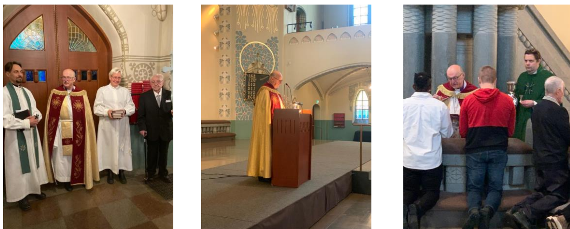
Jumalateenistus sõpruskoguduses Turu Miikaeli kirikus 19. novembril.