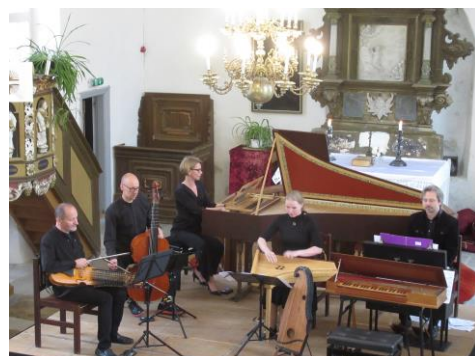
Jaani kirikus pühapäeval 30.07.2023