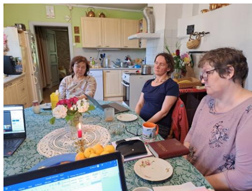
14. juulil oli Johannese Sõnumite toimetuse koosolek pastoraadis.