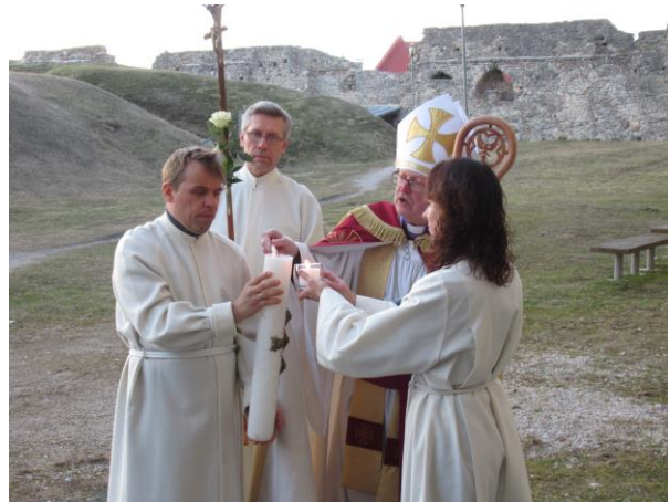
Paasaküünla süütamine 16. aprillil 2022