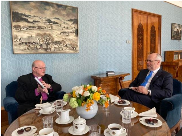
11. aprillil 2022 president Alar Karisele Piibli andmine.