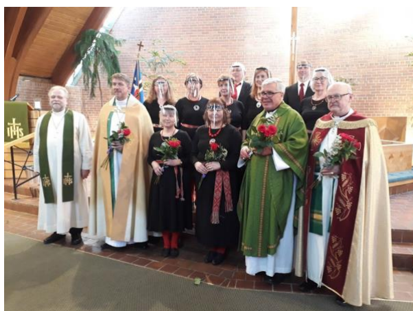
Pidulik jumalateenistus EELK Toronto Peetri kirikus 24.10.2021.