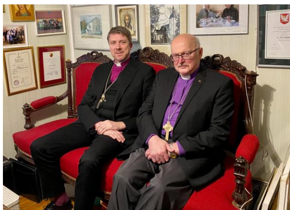
10. veebruaril külastas Haapsalut peapiiskop Urmas Viilma koos abikaasa Eglega.