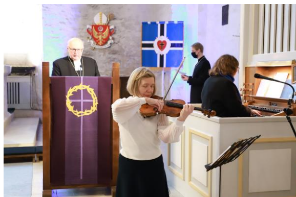
24. veebruaril toimus traditsiooniline Eesti Vabariigi aastapäeva kontsert-palvus toomkirikus.