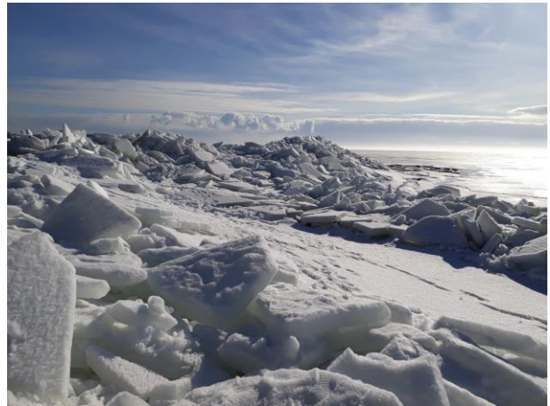
Kaunid jäämäed 15. märtsil Topu rannas