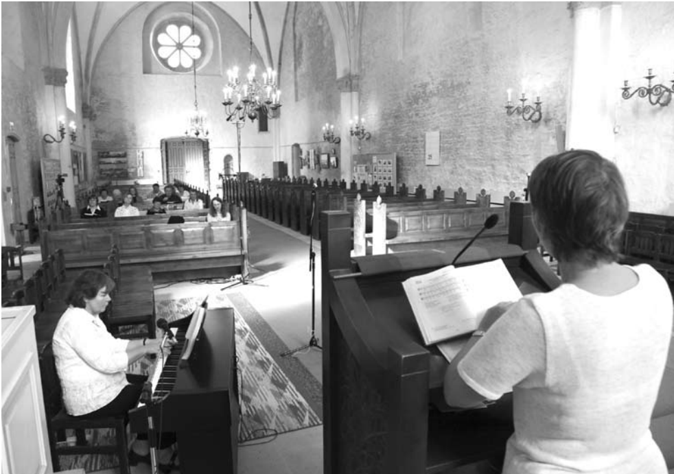
Koraalimaraton Haapsalu toomkirikus.