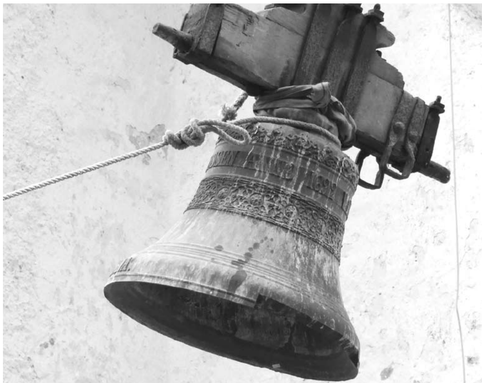
Martna kiriku vana kell teel tornist alla.

Kolmekuningapäeval käisin tornis, et mõtustid täpsustada ja seniste kellade seisundit hinnata. Suurem kell on nii pahasti kahjustunud, et selle edasine kasutamine ei ole võimalik ja see tuleb jätta aktiivsest kasutusest kõrvale. Väiksem kell on terve, vajab vaid armatuuride korrastamist. Sellest teadmisest juhitudes koostasime koguduse juhatusel taotluse MTÜ Kodukant Läänemaale, nähes ette ühe uue tornikella valmistamise ja kelladele elektriliste helistamismasinat paigaldamise. Märtsis saabus teade, et sel aastal on võimalik toetada vaid poole küsitud summaga, see lubab valmistada uue tornikella. Rõõmuga võtsime teate vastu lootuses, et järgmisel aastal saame taotleda raha ka elektriliste helistamismasinat paigaldamiseks. See muudab kellade helistamise käepärasemaks, plaanis