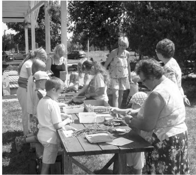
Pühapäevakooli lapsed Nõval.