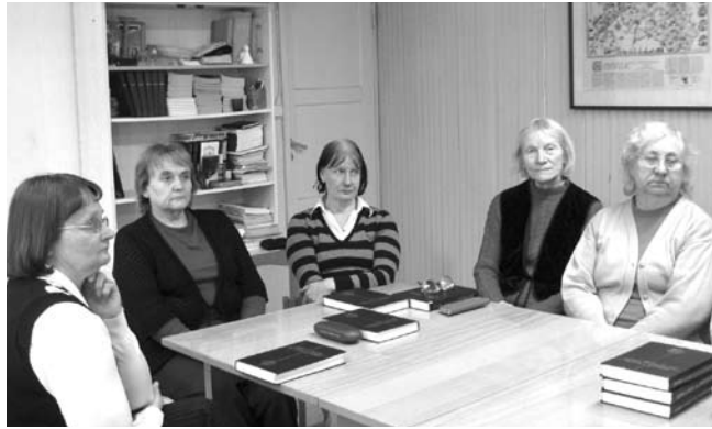
Kullamaa koguduse koolituspäev.