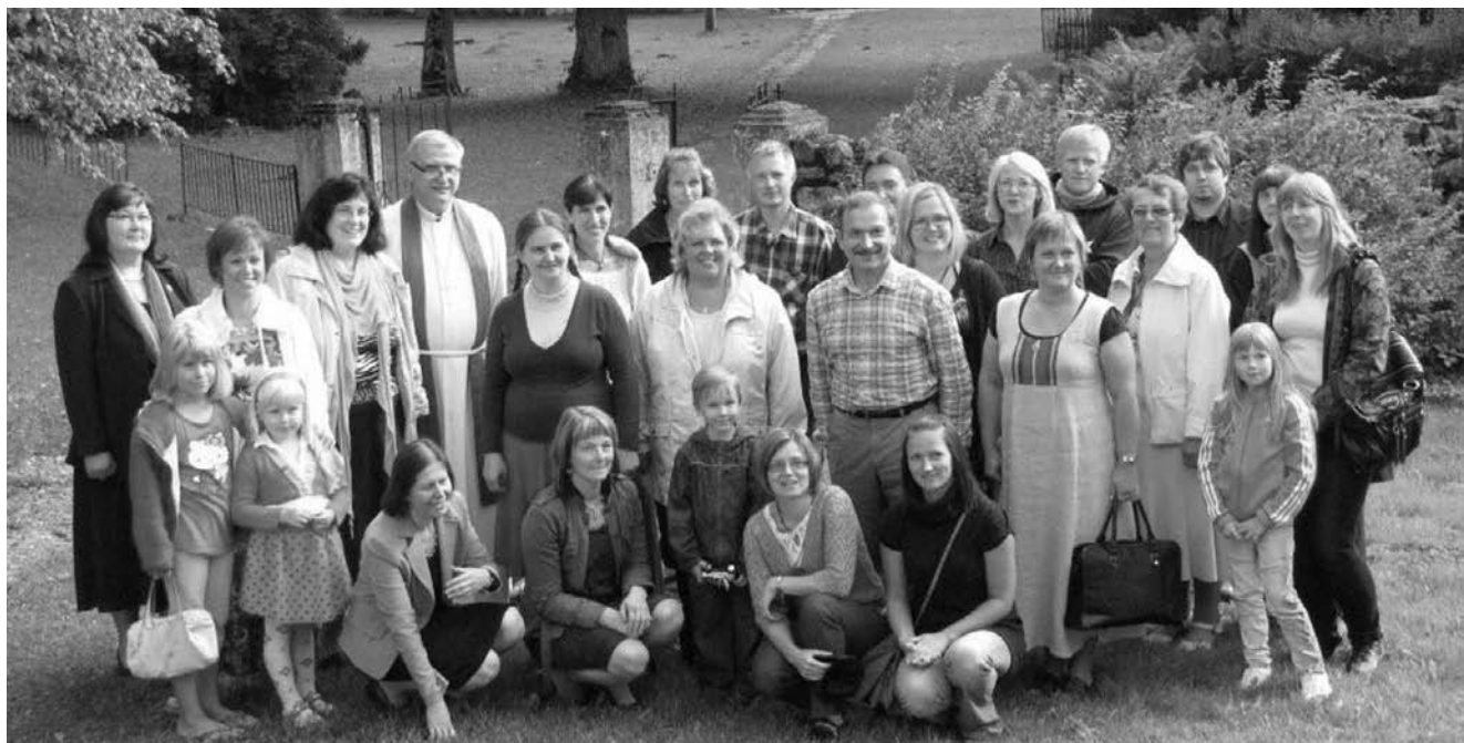
Ansambel Doxa tähistas 25. aastapäeva 4. septembril piduliku jumalateenistusega. Pildil endised ja praegused lauljad.

Nigula tee 1, 90807 Taebala vald, Lääne maakond, tel 479 6658, faks 479 6658, laane-nigula@eelk.ee, www.eelk.ee/laane-nigula/. Koguduse õpetaja Leevi Reinaru, juhatuse esimees Tiina Võsu. Swedbank 1120076599. Jumalateenistus pühapäeviti kl 12.