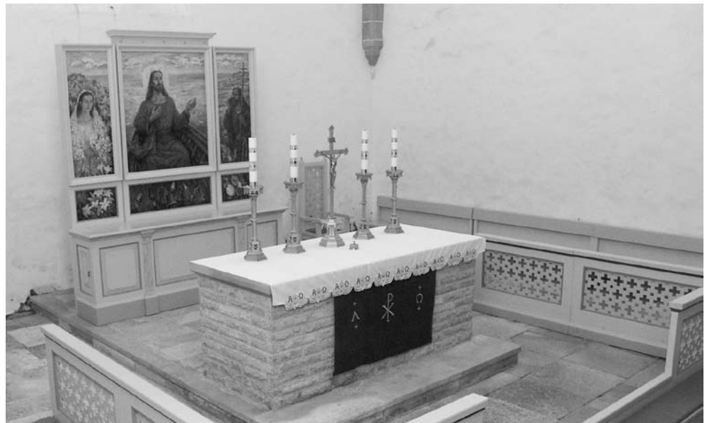
Märjamaa Maarja kiriku altar.

Selle aasta nelipühast seisavad Märjamaa Maarja kiriku altaril Vigala kirikust saadud küünlajalad ja krutsifiks. Kui mujal võiks selliste esemete ühte või teise paika asetamine jääda märkamatuks, siis Märjamaa kirikus aitavad need koondada tähelepanu kirikuruumi kõige olulisemale paigale — altarile.