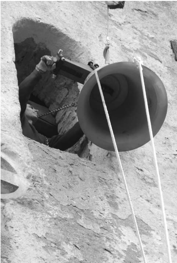
Uus kell jõuab torni.

voolumist ja kingi meistrite vaevale edu. Anna, et uus kell võiks koguduse keskel ülistada Sinu nime. Seda palume Jeesuse Kristuse läbi. Aamen.