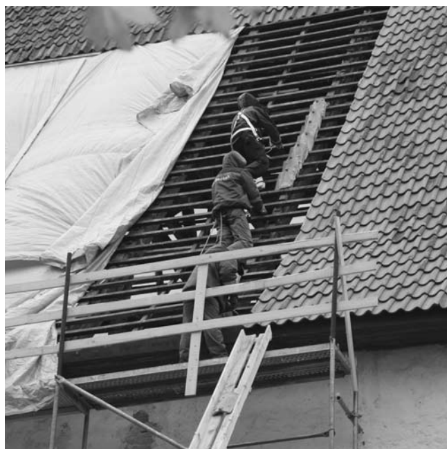
Töömehed Ridala kiriku katusel.