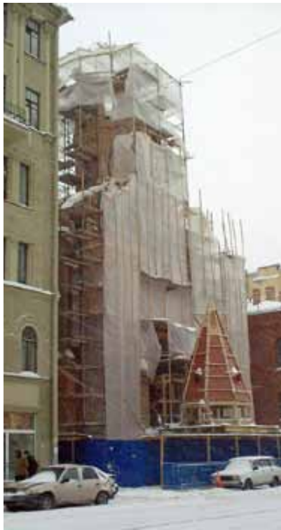
Jaani kirik veebruaris 2009.

27. detsember. Johannesepeäeva kontsertpalvus ja Haapsalu koguduse teenetemärgi üleandmine.