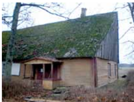
Pikavere palvemaja enne remonti ...