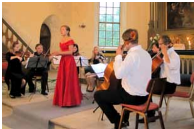
Suvekontsert Lihula Eliisabeti kirikus.

800 aastat on ühe linna kohta väga auväärne iga ja