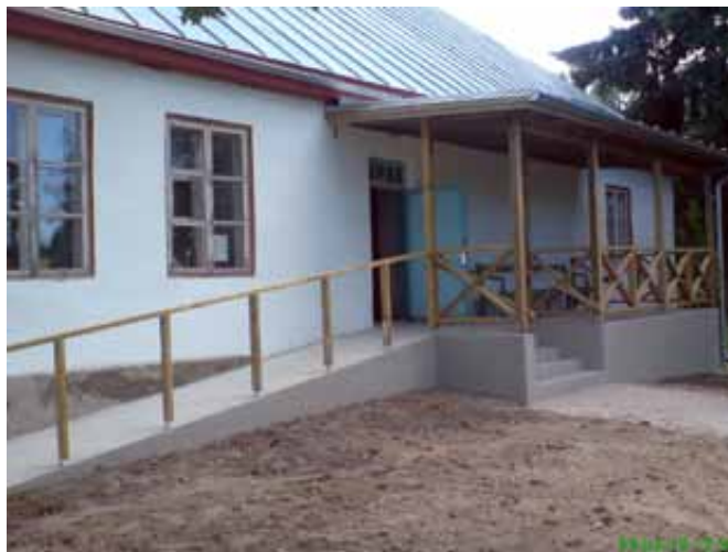
Viimastel aastatel on remonditud Martna pastoraati. 2010. aastal korrastati sissepääs ja ehitati varikatus.

Ise oleme ka midagi suutnud organiseerida. Nüüd on meie kogudusemajal uus nõuetekohane trepp ja nüüd