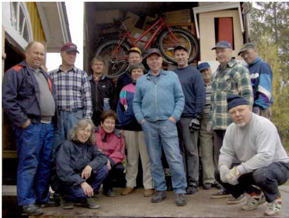
Varbla Soome sõpruskoguduse Pirttikylä rahvas abikoorma juures.

vad sisse väikesi summasid, võtavad vajaliku raha kokku- saamine ka aega. Jõuluõhtul ja jaanipäeval on tavaliselt suuremad korjandused.