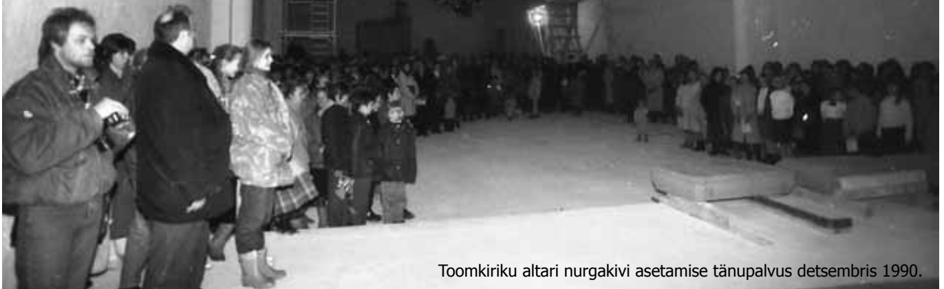
Toomkiriku altari nurgakivi asetamise tänapalvus detsembris 1990.

Toomkiriku taastamisest ENSV nostalgjata