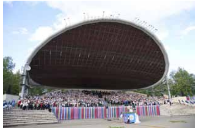
Kirikupäeva kontsert Tartu laulukaare all.

Usu kasvamine on Jumala imeline töö inimeses. Imelus ei tähenda, et Jumal kingib usu vaid üksikutele „imelistele” inimestele. Ei, Ta tahab, et kõik inimesed tuleksid pääsemisele (1Tm 2:4). Ime seisneb selles, et Jumal tahab meile pääste kinkida. See pole mitte tasu meie vooruslikkuse või pingutuste eest, vaid tõeline kingitus. See kingitus antakse meile pühas ristimises ja meil on võimalik seda üha uuesti vastu võtta pihil või tulles missal armulauale.