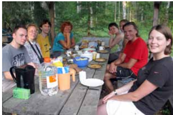
Talgulised Nõva mändide all.

Üks paljudest, kes hindab Nõva kogudusemajas, selle asukohta, loodust, inimesi ja kirikut, on Pereraadio, kristliku hea sõnumi kuulutaja Eestis juba 15 aastat. Raadiomaleva suvepäeva- de päevakavasse mahtusid