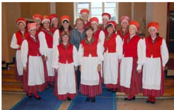
Noarootsi rahvatantsurühm riigikogus.

Üks joon, mida meil on ja teistel pole, on kõik, mis mahub mõiste alla „rannarootsi” — külad, inimesed, mõtted ja teod. Läänemaa rannarootslust tutvustasidki Läänemaa kuu avamisel Noarootsi ja Vormsi saare esindus. Noarootsist käisid riigikogus valla rahvatantsijad, vanade rannarootsi rahvalauludega astusid üles nii valla kui ka koguduse laulunaised. Pärast etteastet sai riigikogu esimehe Ene Ergma juhatusel tutvuda riigikogu hoonega,