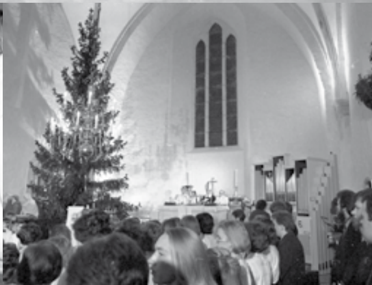
Haapsalu Toomkiriku taastamine ja pühitsemine 1990