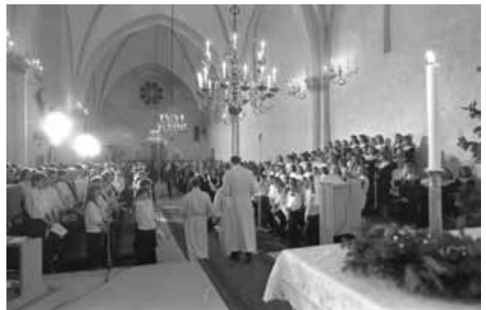
Jumalateenistus 24. detsembril 1990.

1969–1971 valmis piiskopilinnuse konserveerimise ja rekonstrueerimise eskiisprojekt (arhitekt Eda Aru, sisekujundaja Aala Buldas, projekteerimistö juhendajad