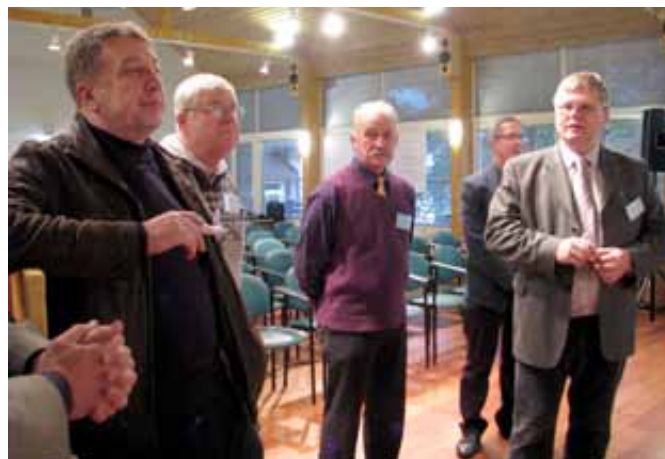
Juhatusesimehed nõu pidamas.

Konverentsi teema oli „Meie kirik — keda see huvitab?”. Sellele küsimusele otsisime vastust terve laupäeva avatud ruumi põhimõtetel tegutsenud töötubades. Töötubade teemasid ei olnud korraldustoimkond ette andnud, teemad tulid esile ligi 90 osavõtja enda keskel, teema