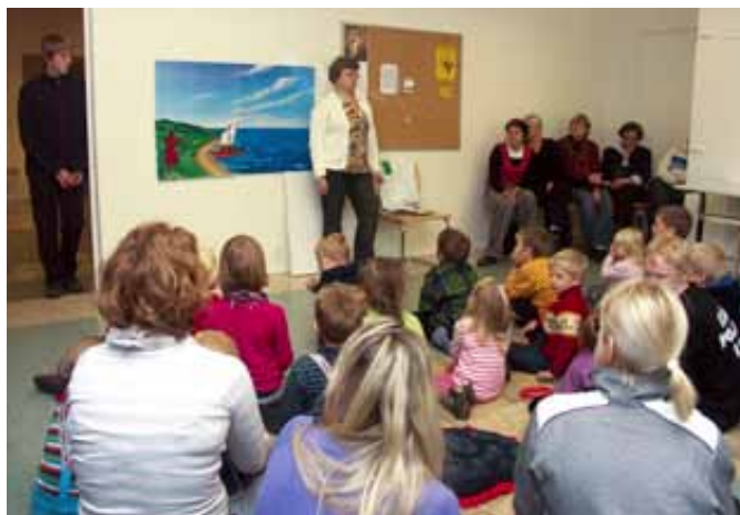
Perepäev Märjamaa koguduses.

Eelkooliealised lapsed said ronida emade-isadega kiriku