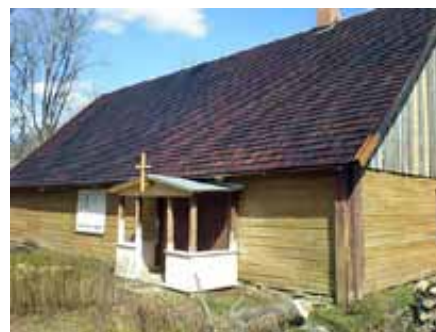
... ja pärast remonti kevadel 2010.