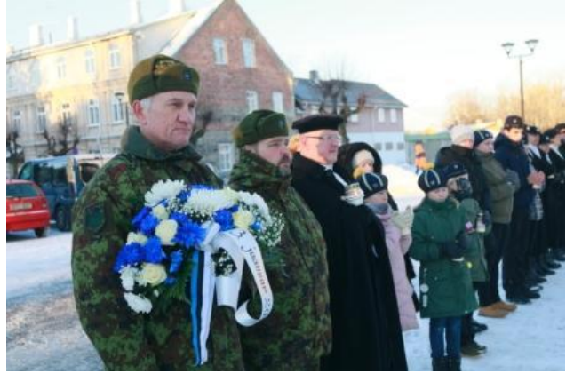
Vabadussõjas võidelnute mälestuspäev 3.01 Vabadussamba juures