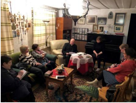
Johannese Sõnumite toimetuse koosolek 26.01