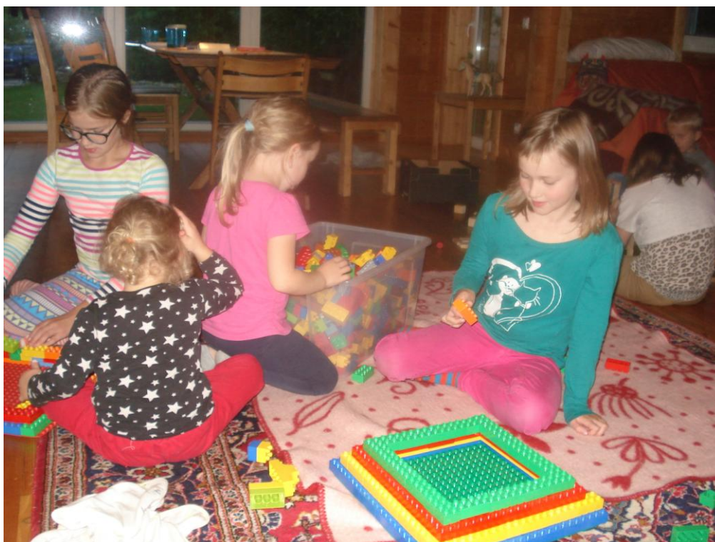
„Aardeotsijate“ piiblitunnis proovisid lapsed ise Paabeli torni ehitada.