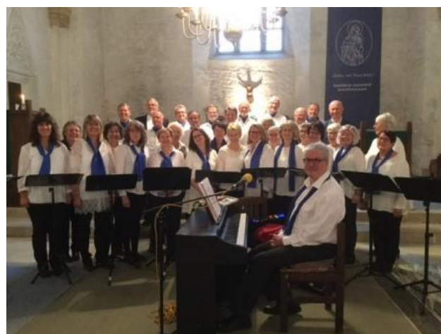
Haapsalu sõpruslinna Hanko gospelkool "South Point Gospel"