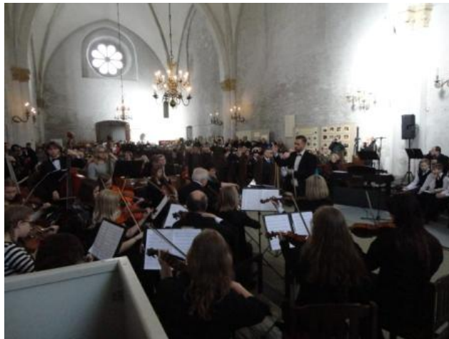
24. veebruaril Eesti Vabariigi 99. sünnipäev Haapsalu toomkirikus