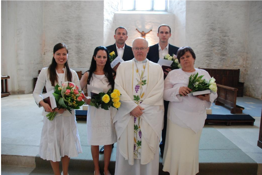
Konfirmeeritud Haapsalu toomkiriku altari ees 25. mail 2014.

Kümme käsku. Paljud inimesed on arvamusel, et igasugused käsud ja piirangud on tänapäeval paljude inimeste jaoks ajast ja arust. Inimene peab olema vaba ja saama teha seda, mida ise tahab! Pärast väikest järelemõtlemist selgub - niikaua, kuni tema vabadus teiste vabadust ei ohusta. Vaevalt meeldiks kellelgi liigelda ilma liikluseeskirjadeta. Meie tänavatel liigub ringi küll neid, kellele liikluseeskirjad paistavad üksnes tülikaks segajaks olema. Me ei tahaks nendega sõiduteel kohtuda. Liikluseeskirjad ei ole loodud meid segama vaid kaitsma. Sama on Jumal kümne käsuga. Inimest tuleb kaitsta ka tema enese eest, inimesele on parim, kui ta elab kooskõlas oma Looja seadustega. Omal moel kuuluvad ka kümme käsku loodusseaduste hulka.