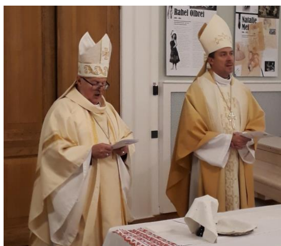
28. novembrist kuni 1. detsembrini külastan peapiiskop Urmas Viilmaga Moskvat. Kohtume Moskva ja kogu Venemaa pühima patriarhi Kirilliga ja pidasime jumalateenistuse Eesti Vabariigi Suursaatkonnas Moskvast.