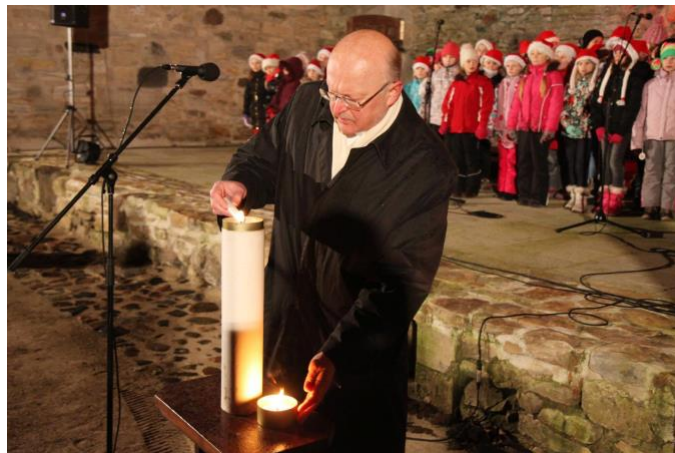
Advendiküünla süütamine piiskopilinnuse õuel aastal 2013.

Koguduse häälekandja ilmub alates septembrist 2008. Ootame lugejate kaastöid, küsimusi ja soove, millest järgmistes Johannese Sõnumites lugeda soovitakse. Palume teie abi, et Johannese Sõnumid jõuaksid võimalikult paljude huvilisteni. Teatage soovijate e-posti aadress koguduse kantseleisse.