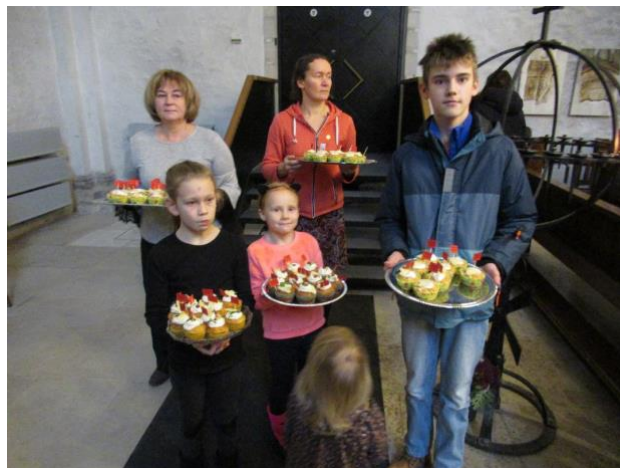
Isadepäev 10. november.